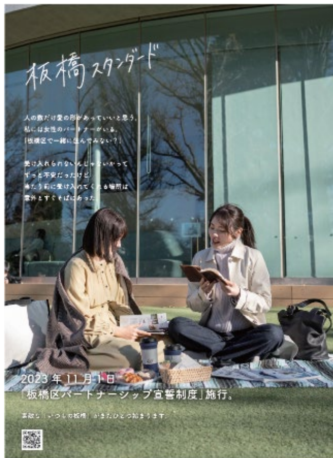
暮らしやすいが、叶うまち。板橋区

制度開始にあわせ区の重要な施策として、浸透・定着させていくため、日本大学芸術学部と連携し、PR動画・ポスターを各6種類作成しました。動画・ポスターによる啓発を通じて、区におけるダイバーシティ&インクルージョンを推進し、性的マイノリティ当事者の生活上の不便を軽減するとともに、差別・偏見・いじめのない社会をめざします。