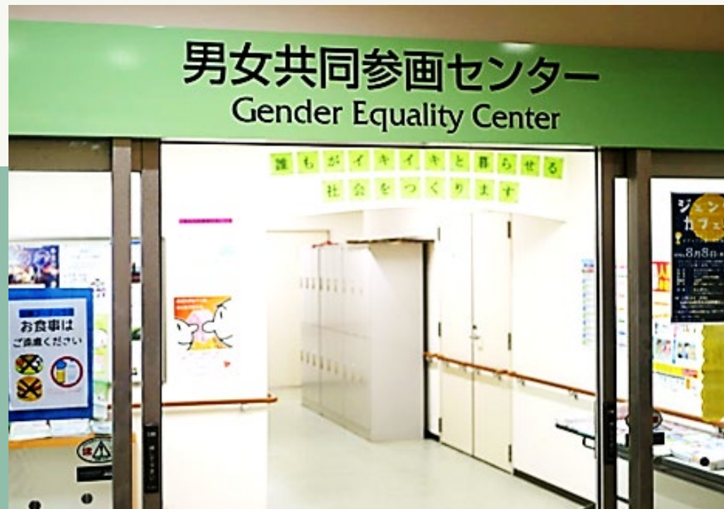
男女共同参画センター「ゆーあい」

男女共同参画社会の形成促進に関する情報及び学習機会の提供、相談事業などを行っています。