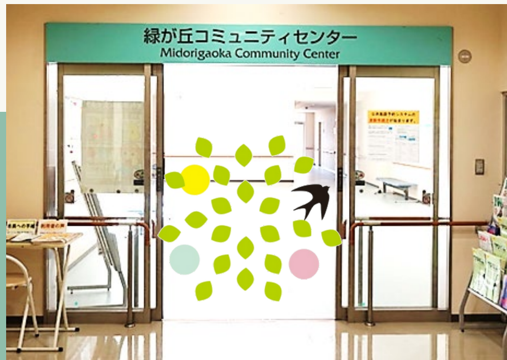
緑が丘コミュニティセンター

男女共同参画社会の形成促進に関する情報及び学習機会の提供、相談事業などを行っています。