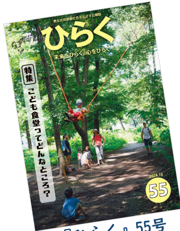
『ひらく』55号 (令和6年10月発行)