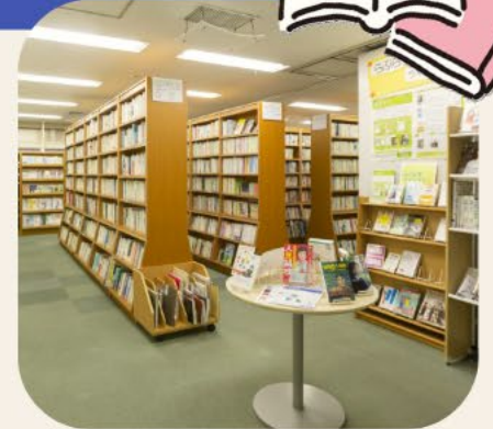
本や漫画、DVD等があるライブラリー