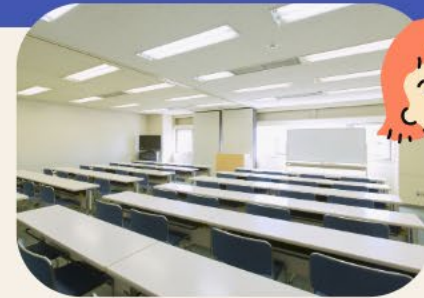
団体の会議や学習会などに使える研修室