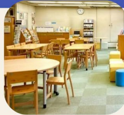
グループ活動ができる情報・交流コーナー